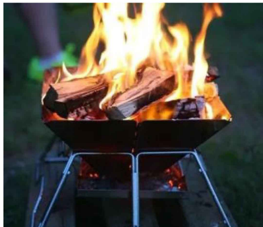
焚き火の補助燃料に！

※紙薪単体では炎が上がらず、織火状（炭のような燃え方）となりますので、あくまでも補助燃料としての使用をお勧めします。